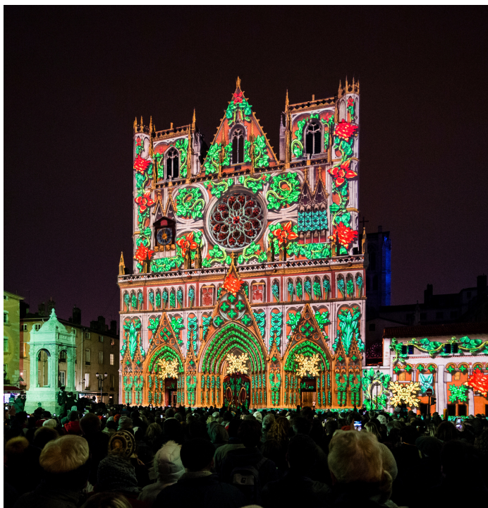
FÊTE DES LUMIÈRES