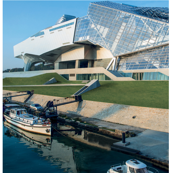
MUSÉE DES CONFLUENCES

Ranskan sana confluence, joka tarkoittaa sananmukaisesti yhteenvirtaamista, on myös nimi Lyonin alueelle, jossa Rhône- ja Saône-joet yhtyvät kaupungin keskellä olevan nimen eteläkärjessä . Lyonin teollinen kehitys, rautateiden kasvu, rakentaminen ja satama vaikuttivat kaupunginosan dynamiikkaan 1800-luvun alussa. Vuonna 2000 La Confluence kävi läpi muutoksen, kun päätettiin ottaa tämä teollinen kaupunginosa mukaan osaksi kaupungin keskustan kehittämistä. Tuolloin rakennettiin toimistoja, hotelleja ja asuntoja, ja La Confluence on nyt – modernin ja vastakohtaisuuksia luoneen arkkitehtuurinsa ansiosta – aivan erityinen paikka Lyonissa. Alueella on myös teolliselta arkkitehtuuriltaan ainutlaatuinen Le Musée des Confluences - museo, joka vaikuttavine 2,2 miljoonan esineen kokoelmineen muodostaa teräksisen ja lasisen tiedon valtakunnan. Vuonna 2014 valmistuneen museon visiona on tutkia ja ymmärtää maailman monimuotoisuutta ihmisten, näkökulmien ja luonnon kohtaamisten kautta.